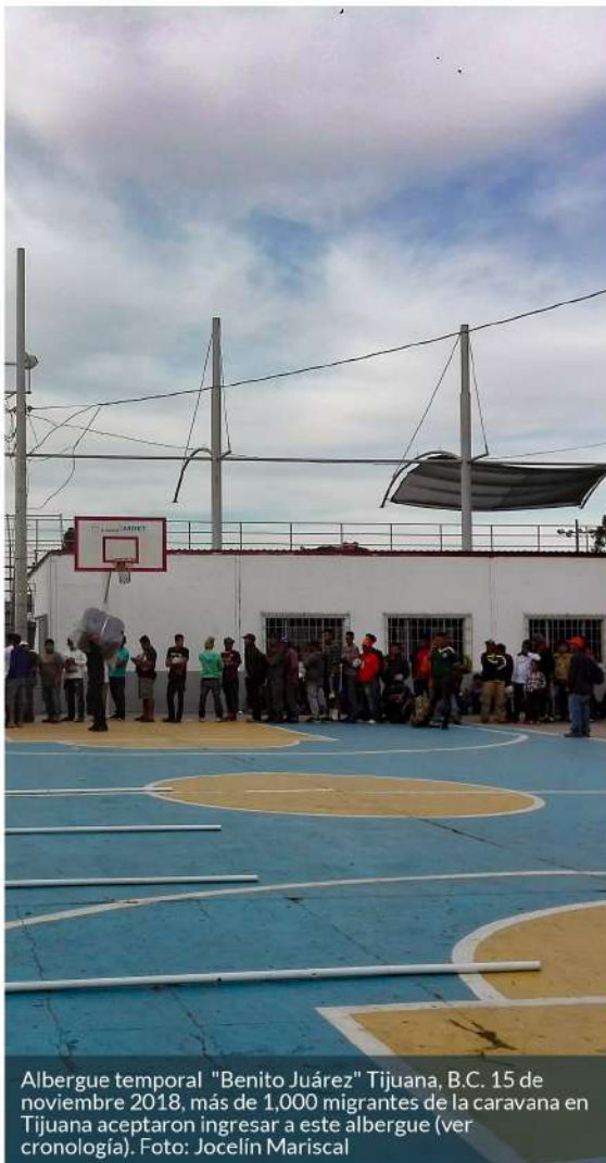
Albergue temporal "Benito Juárez" Tijuana, B.C. 15 de noviembre 2018, más de 1,000 migrantes de la caravana en Tijuana aceptaron ingresar a este albergue (ver cronología).

Este número de la Gaceta Migratoria está dedicado a las Caravanas de Migrantes en México. En el Observatorio continuamos monitoreando la legislación y política migratoria de Estados Unidos, México y países centroamericanos que, desde diferentes niveles gubernamentales, afectan los derechos humanos de personas cruzando fronteras como las que integraron estos grupos desde octubre del 2018.