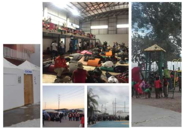
Galería: Albergues Temporales en Tijuana 2018