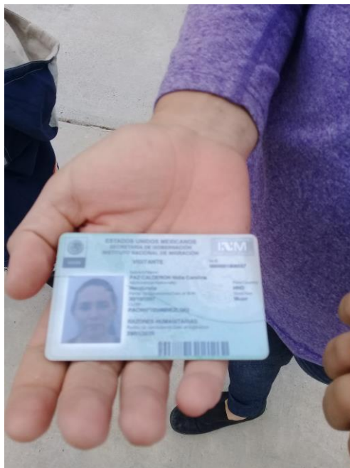
Fotografía 5. Mujer hondureña mostrando su visa humanitaria en Reynosa.