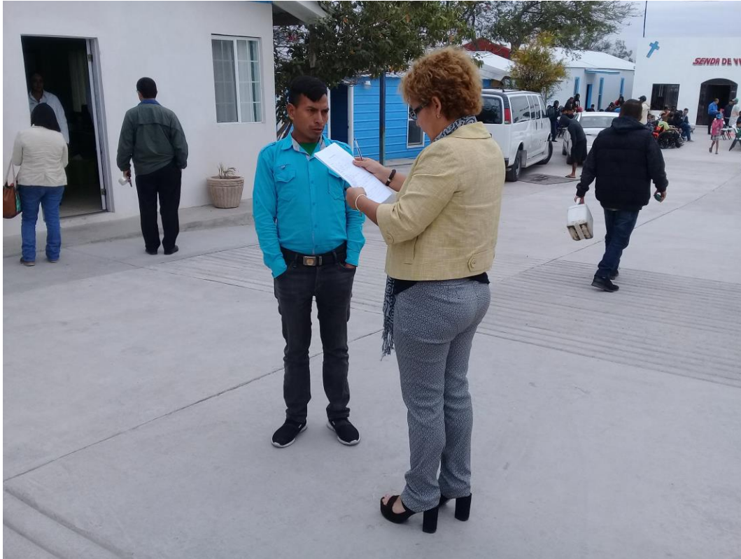
Fotografía 3. Encuestando a migrante en albergue de Reynosa.