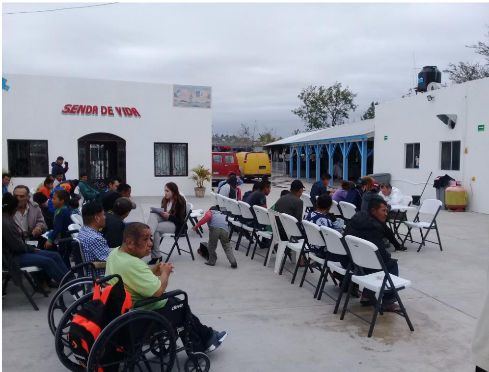
Fotografía 4. El Instituto Tamaulipeco para los Migrantes en albergue de Reynosa.