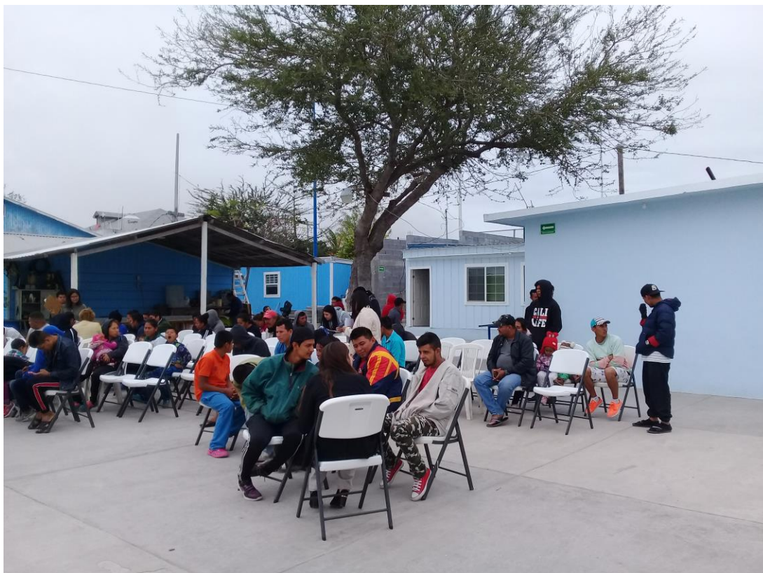
Fotografía 1. Migrantes reunidos en patio del albergue “Senda de Vida”, Reynosa.