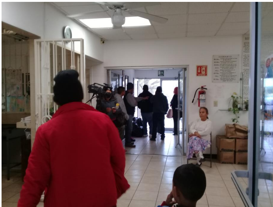
Fotografía 9. Medios de comunicación en Casa del Migrante en Matamoros.