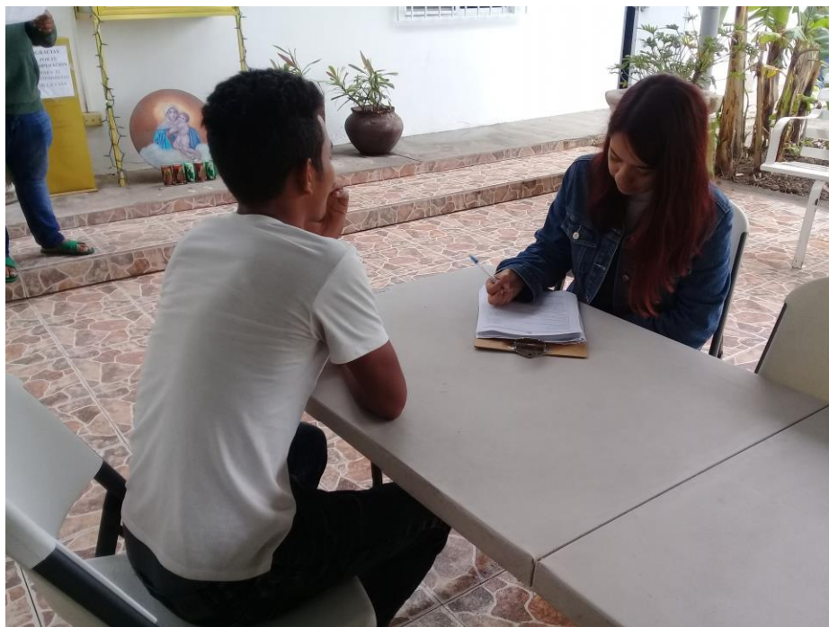
Fotografía 6. Encuestando en Casa del Migrante en Matamoros.