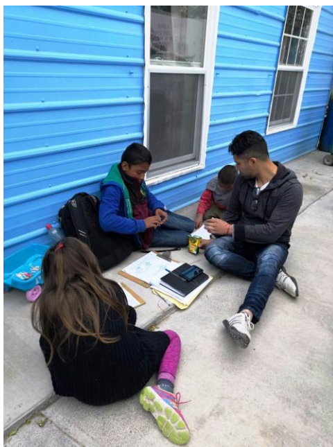
Fotografía 11. Niños hondureños dibujando en albergue en Reynosa.