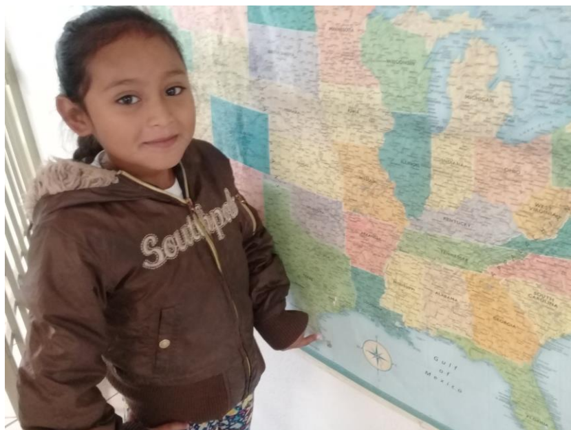
Fotografía 8. Niña guatemalteca señalando mapa en albergue de Matamoros.

Fuente: Oscar Misael Hernández, trabajo de campo, 2019.