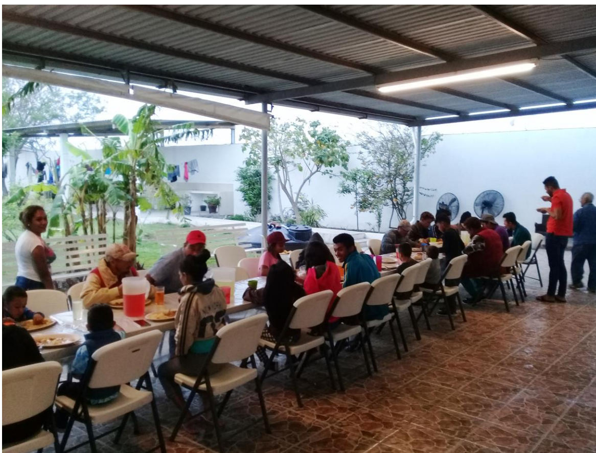
Fotografía 2. Migrantes comiendo en Casa del Migrante “San Juan Diego”, Matamoros.